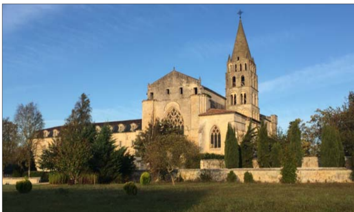
Pour l'abbaye, une nouvelle ère s'ouvre à l'instar de celle de Saint-Jacut-de-la-Mer, dans les Côtes d'Armor, déjà engagée dans une reconversion similaire réussie.